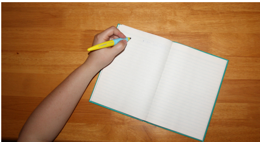
Obr. Č. 1 Vedenie hrotu pera