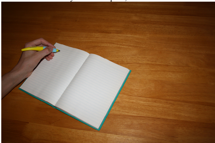
Obr. Č. 3 Správny sklon pera a zošita